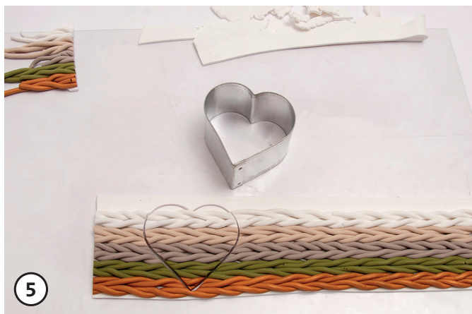
5 Usar un molde de galletas para recortar y recoger el motivo.