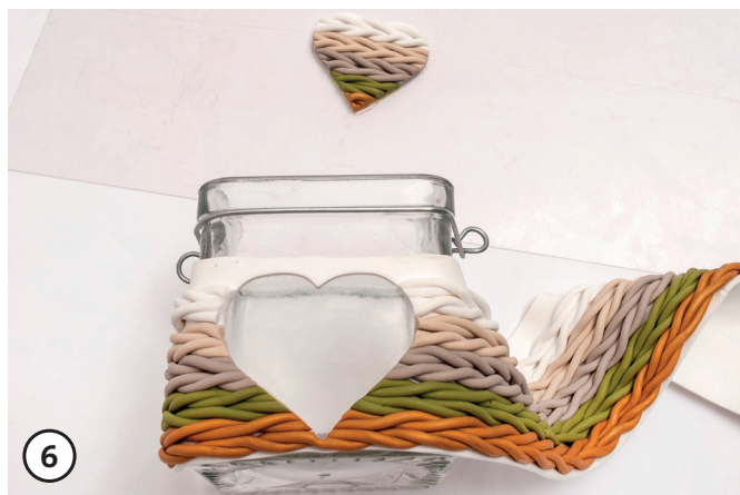
6 Poner la cinta de tejer (Fimo) en el vaso y ajustar.