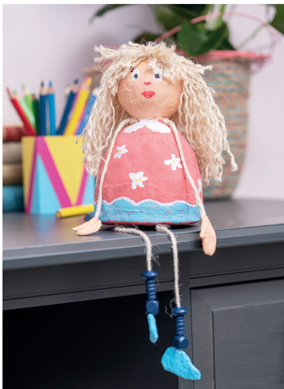
Figura para estante