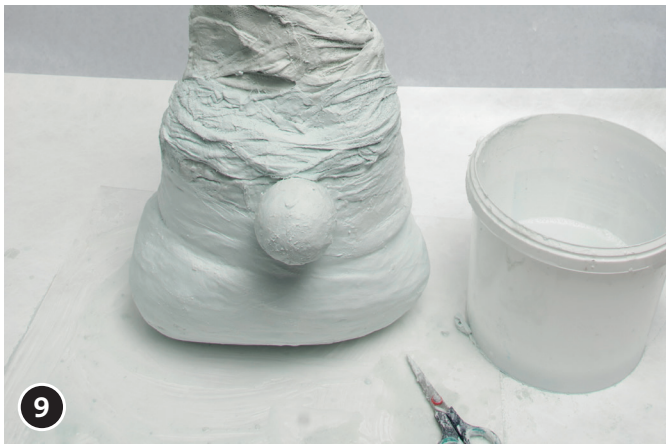
9 Envolver por completo el gorro de malla de alambre con vendas de modelar. Dejar secar de uno a dos días.