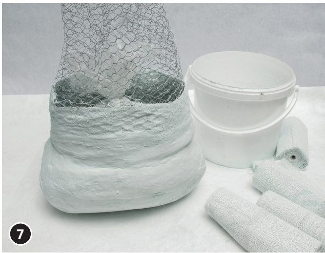
7 Utilizar vendas de yeso para unir el cuerpo al sombrero.