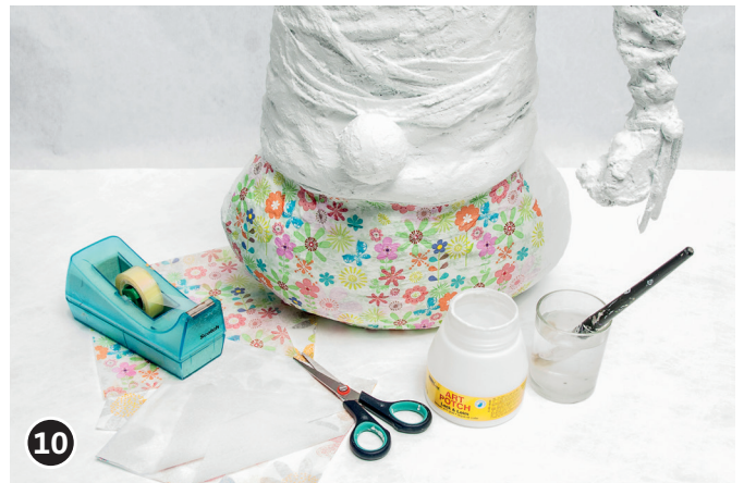
10 Separar la parte impresa de la servilleta de las otras dos capas de papel. Cortar las servilletas al tamaño deseado (medir el cuerpo de los duendes). Colocar las servilleta con motivo (capa superior) con la parte de abajo encima del cuerpo de los duendes. Embadurnar la servilleta con la cola para servilletas aplicándola en el centro e ir repartiéndola hacia los extremos con un pincel de cerdas blancas, con cuidado de no romperlas. Cubrir por completo el cuerpo de los duendes con servilletas. Dejar secar la cola toda una noche.