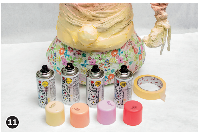
11 Pintar los gorros con el spray del color o colores que se deseen. Dejar secar la pintura toda la noche.