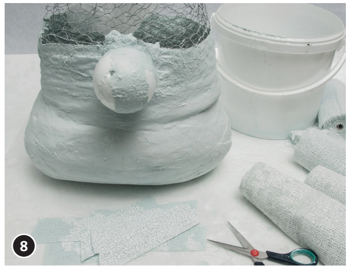
8 Fijar el cono de pórex (la nariz) a la parte de delante del gorro con más vendas yeso.