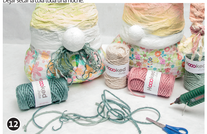
12 Para hacer el bigote, cortar el hilo de yute a la longitud deseada, anudar por el medio y fijar con pistola termoencoladora.

¡El equipo creativo de OPITEC desea que se divierta mucho!