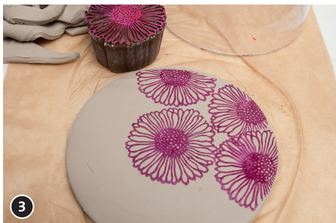
3 Untar un sello de bloque de madera en el tampón de tinta chalky. Aplicar la tinta, presionando con el tampón para que el motivo quede grabado en relieve, hasta cubrir toda la superficie del círculo.