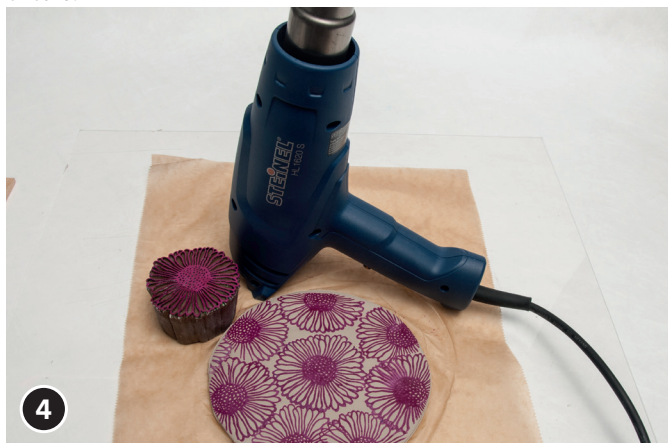
4 Secar la tinta con una pistola de aire caliente o un secador de pelo.