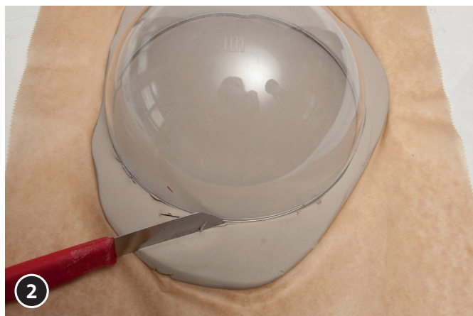
2 Colocar una de las mitades de una bola de plástico sobre la plancha de arcilla. Reseguir el contorno con un cuchillo de punta afilada para recortar un círculo.