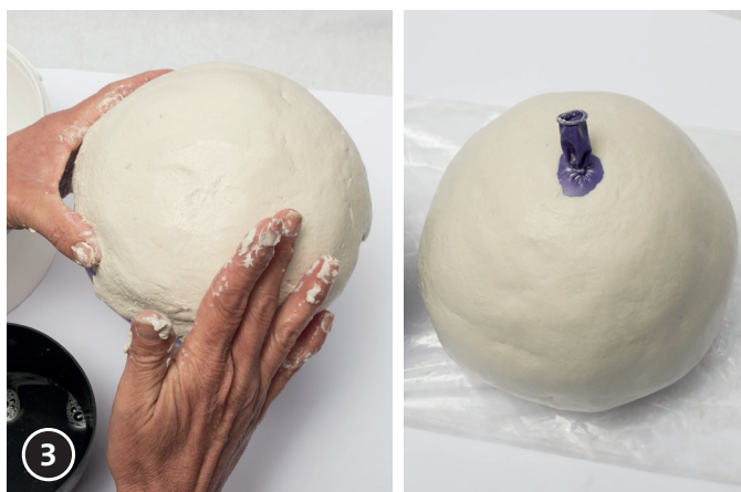
3 Alisar la superficie con un poco de agua.