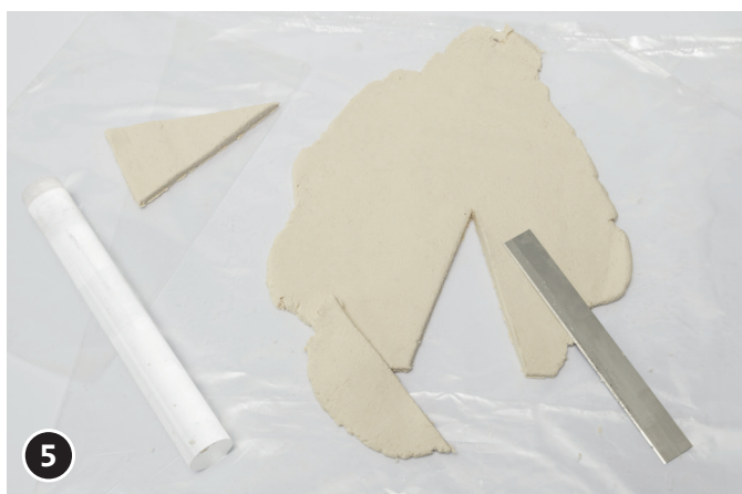
5 Recortar un triángulo para hacer el pico.