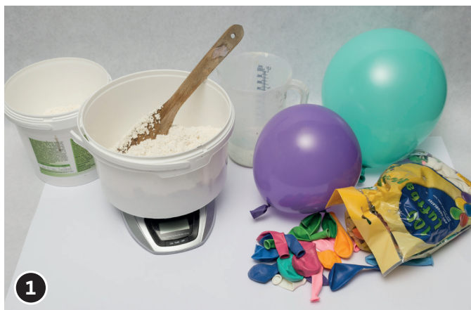
1 Mezclar el papel maché con el agua siguiendo las instrucciones del fabricante.