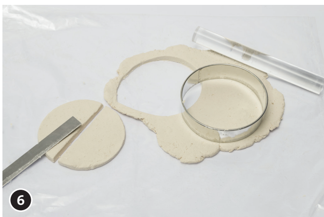
6 Recortar un círculo para hacer las alas y cortarlo por la mitad.