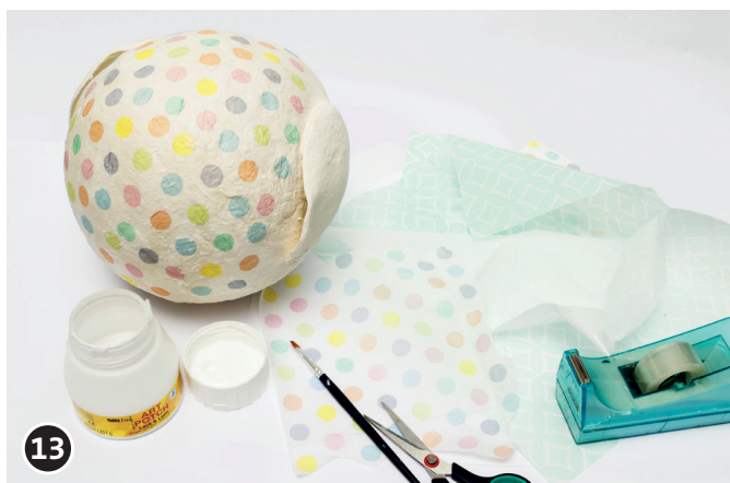
13 Forrar el cuerpo y las alas del búho con servilletas siguiendo el mismo procedimiento que con los medallones. Dejar secar bien la cola.